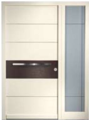
H 212 DS | Außenansicht