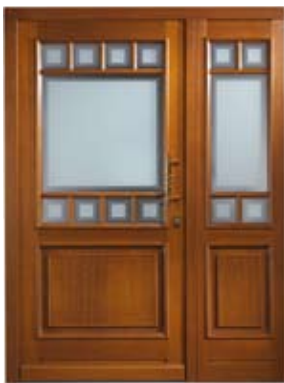
H 506 ZL | Außenansicht