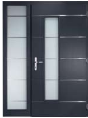
H 203 DS | Innenansicht