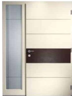
H 212 DS | Innenansicht