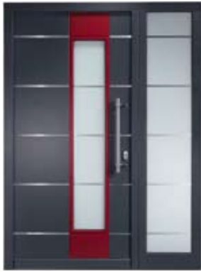
H 203 DS | Außenansicht