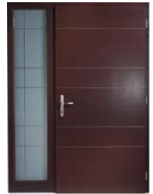
H 213 DS | Innenansicht