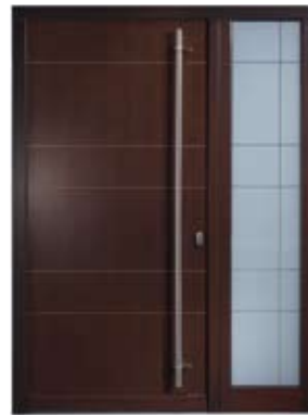
H 213 DS | Außenansicht