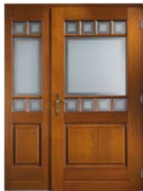
H 506 ZL | Innenansicht