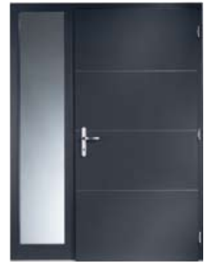
H 211 DS | Innenansicht