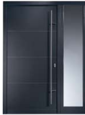
H 211 DS | Außenansicht